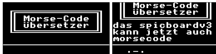
Übersetzer für Morse-Code (ebenfalls auch ohne Display nutzbar)

Die fertigen Implementierungen können über das Verzeichnis /proj/i4gspic/pub/bonus/ auf das SPiC-board überspielt werden, außerdem ist der vollständige Quelltext dazu auf https://gitlab.cs.fau.de/i4/spic/ veröffentlicht.