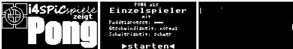
Umsetzung des Videospieldassikers Pong