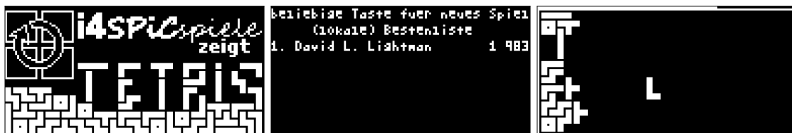
Handheld für das Puzzlespiel Tetris